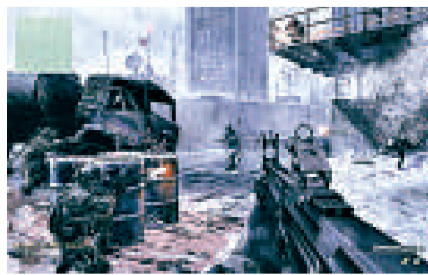
▲第一身射擊遊戲Call of Duty是全球銷量最高的遊戲之一

天文學家庫珀博士也認為這並非太空船。她告訴《每日郵報》說：「科研人員暫時還未能將水星的影像移除。技術人員試圖將移動物體的影像移走時，發現像素會互相混合，影響辨識。其實這應該只是成像過程中的小插曲。不大可能出現像水星那麼大的宇宙飛船，要知道，水星和月亮是差不多大小的。」