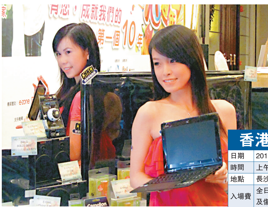
▲今年的香港電腦節橫跨至明年

【本報訊】除一年一度工展會外，今年的香港電腦節亦會橫跨至明年，「電腦節2012」在本月三十日至明年一月二日一連四天於長沙灣遊樂場隆重舉行，更適逢電腦節踏入十周年，主辦單位香港電腦商會推出多項優惠，希望藉此吸引市民，商會指出政府向本港永久居民派發六千元，對銷情將大有幫助，相信未來即使經濟前景不明朗，亦有信心可打破去年二點八億的營業額及五十三萬人流。