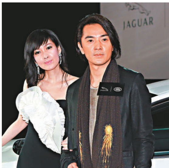
▲鄭伊健(右)與周慧敏出席新車活動

Vivian昨日澄清已很久沒去醫院，相信是用舊照片來炒作，更反問現場記者：「我像不像有孕?不會一窩蜂的，這些不會有連鎖反應。我們夫婦二人已決定不要(兒女)，女人不一定要經歷生育女。」