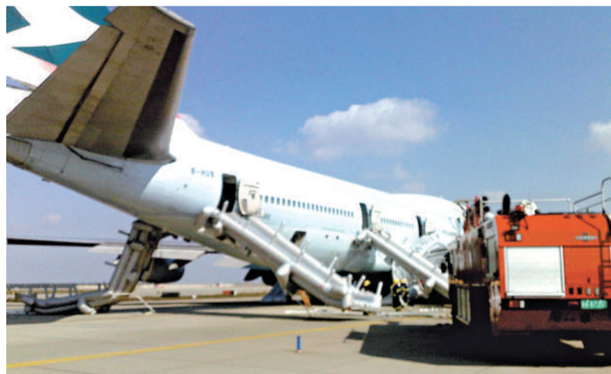
消防員在CX365航班旁準備滅火水帶，以防不測

有機上乘客隨後更新說：他們已被安全送到機場休息室，「大部分都沒事，緊急跳艙有人受傷，刺激濃煙是從機艙的前艙冒出來的，緊急疏散的時候機組要求不能拿行李，很多人倉皇跑出去衣服也沒拿結果在戶外被凍得不行！目前乘客情緒穩定，等候安排！乘客們都在感嘆還好是在起飛前發現的！」