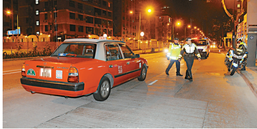
▲涉案的士，連撞三車後被警截停

【本報訊】九龍城窩打老道出現「瘋狂的士」，一輛空載的士昨日凌晨在窩打老道撞向一輛載客的士後，竟不顧而去，逆線駛入太子道西，向東行五百米後再撞及兩輛的士，警方接報沿途追截趕抵，最後在喇沙利道附近將肇事的士截停，司機呆坐車內陷半昏迷，由救護員送院檢驗，事件中幸無人受傷，肇事的士司機涉嫌危險駕駛被捕，警方正調查他是否受藥物或吸食毒品影響。