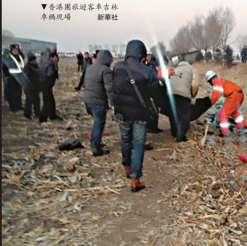
香港團旅遊客車吉林車禍現場