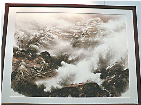
▲廣東畫家朱頌民新作《大嶽》