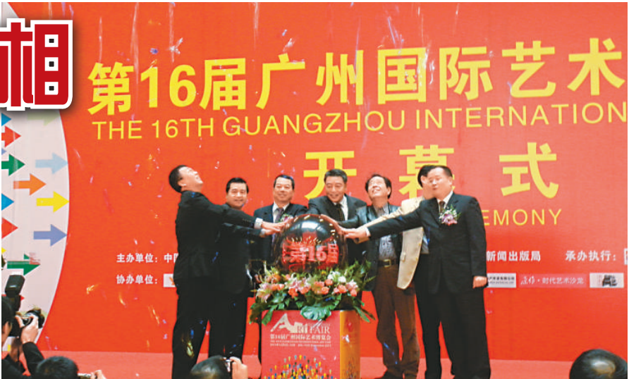
▲嘉賓共同主持開幕式

內地藝術家及藝術機構的展覽則有：中國美術家協會精品展、《百年廣州》油畫展、「李家山水系列畫展」（李可染、李小以及