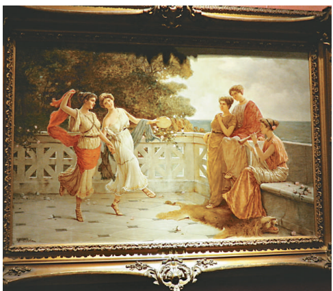
▲依瑪尼爾·哥斯特《愛琴海邊的歡樂女神》，一八九八年

《史比力冒險故事：深海奇兵》以英語演出，附中文字幕，於十二月十六及十七日（星期五及六）晚上八時；十二月十八日（星期日）下午三時，在香港文化中心劇場演出，門票於各城市電腦售票處、網上及信用卡電話訂票熱線發售，查詢可電二二六八七三二三。