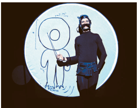
融合偶戲、音樂及動畫 ▲《史比力冒險故事：深海奇兵》

【本報訊】澳洲章比湯匙劇團來港演出獨腳戲《史比力冒險故事：深海奇兵》，以火柴人動畫和偶戲講述感人故事。