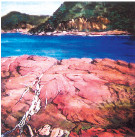
▲俞宙娟筆下的赤門砂岩

香港環保署與香港中國老年書畫研究會合辦的「近在咫尺——香港地質公園展」本月十三日起在文化中心露天廣場C區展出，展期至本月十九日。