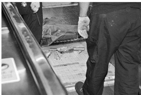
▶踏板邊四個金屬「梯梳」零件飛脫彈出損毀