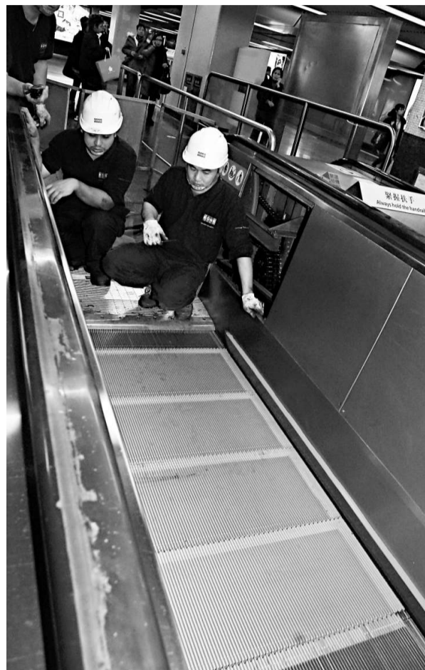
▲頂部四級樓梯拱起移位，其中一級升高約一吋

【本報訊】人流如鯽的港鐵沙田站昨日發生「炒級」意外。月台一條扶手電梯運行中途，梯頂四塊梯級突然相繼拱起，撞向梯頂零件「炒級」，部分零件飛脫彈出，乘客受驚失措一度混亂，一名小童疑被撞跌倒受輕傷；幸電梯自動剎車未釀巨禍。港鐵不排除因一顆外來螺絲造成意外；電梯業人士認為扶手梯安全系統或出問題，機電署應跟進。