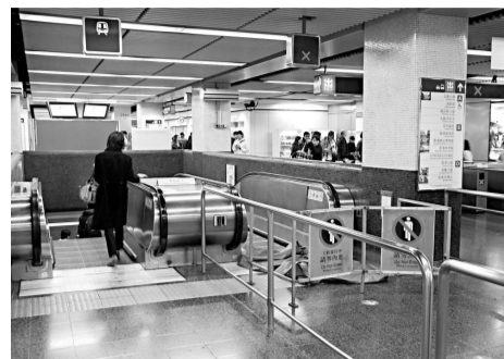
▲出事電梯由月台往大堂，接近車站C出口