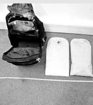
▲價值一百二十萬元冰毒被藏在行李暗格內

【本報訊】海關前晚在香港國際機場破獲百萬元冰毒案。一名來自西非貝寧的男子，準備轉機前往菲律賓時，海關人員發現其行李夾層藏有約一點六公斤「冰」毒，市值約一百二十萬元，遂將他拘捕扣查。