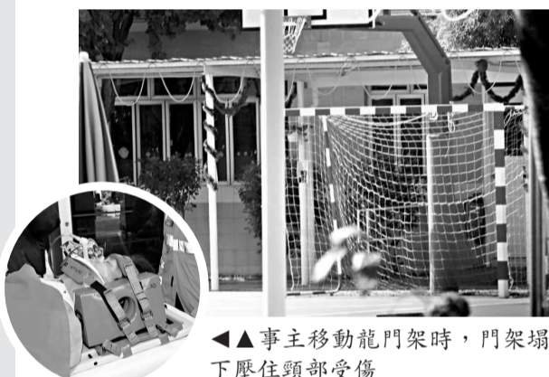
▲事主移動龍門架時，門架塌下壓住頸部受傷

現場在金巴倫道三號一所學校，受傷男工年約五十歲，據悉是兼職「花王」，涉禍龍門架高約兩米、闊約三米。昨日下午一時許，他在學校內工作，在球場移動一個小型龍門架期間，門架突然塌下，他冷不提防，走避不及被壓着頸部受傷。在場其他員工見狀立即報警，並上前將他救出。救護員到場替他戴上頸箍作初步治療，然後送伊利沙伯醫院醫治。警方正調查意外原因。