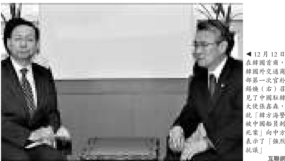
◀12月12日在韓國首爾，韓國外交部第一副官朴錫煥（右）召見了中國駐韓大使張鑫森，就「韓方海警被中國船員刺死案」向中方表示了「強烈抗議」

他表示：「中韓兩國已簽署漁業協定，就漁業生產和管理作了相應安排。中方主管部門已多次採取措施，加強對漁民教育和對出海漁船的管理，制止越界捕魚和違規操作現象發生，同時希望韓方能充分保障中國漁民的合法權益，並給予應有的人道主義待遇。中方願與韓方共同努力，推動中韓漁業合作繼續健康發展。」