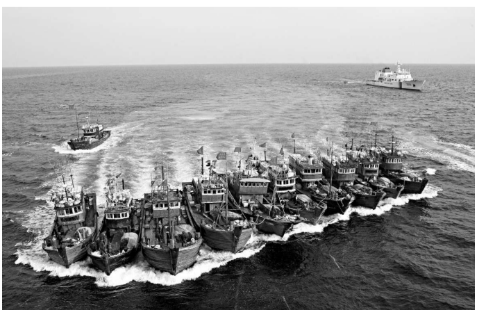
▲11月16日，中國漁船用「鐵鎖連環」的方式，齊頭綁在一起在黃海航行 資料圖片

越界「非法捕撈」的根本原因在於「僧多粥少」。2001年，《中韓捕魚協定》簽署當時中國的漁船數量約達515,000艘，而韓國僅約86,000艘。而與日韓等國簽訂的捕魚協定，使得中國漁船失去了很多進入日韓漁場作業的機會。但中國的漁船數量卻還在增長，去年中國漁船總數達到近100萬艘，全國漁業人口約3000萬人，漁業產量約5000萬噸，是毫無疑問的世界第一漁業大國。這使得大、中馬力漁船不得不調向近海，集結在近海漁場，這些漁場歷來以中小船隻作業為主，船隻密度高、作業空間小、漁業資源嚴重衰退。大、中馬力漁船的加入更增大了漁場壓力。雖然，中國漁船也並非不能到韓國的專屬經濟區進行捕撈，但按照協定，去那裡捕撈的中國漁船每年都有配額，2012年的配額數量定為1650艘，捕撈量為6.25萬噸，比2011年還有所下降。這就是為什麼「非法捕撈」屢禁不絕的根本原因。 (騰訊網)