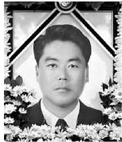
▲被刺身亡的韓國警長李清浩（音譯）

韓國海警將兩艘中國漁船中的一艘和9名中國船員押往仁川港。撞擊漁船妨礙海警執行公務的另一艘中國漁船駛離現場。海警出動3000噸級警備艇和直升機追蹤該漁船。