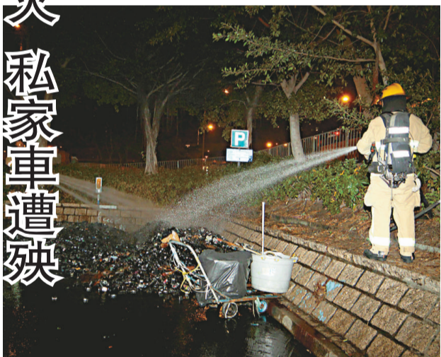
▲一批被棄置的打印機墨盒，突然起火冒煙

棄置墨盒起火 私家車遭殃 【本報訊】長沙灣興華街西一個露天停車場昨日凌晨發生火警，一批被棄置泊車位的打印機墨盒，突然起火冒煙，旁邊一輛私家車被輕微波及，消防員趕到將火撲熄；經調查火警無可疑。昨日凌晨零時許，興華街西近碼頭一個露天味表停車場，大批由紙箱盛載的打印機墨盒起火，火光能冒出大量濃煙，途人見狀報警。消防員到場灌救，迅速將火撲熄，紙箱及墨盒付諸一炬；附近一輛私家車被輕微波及，車門遭煙熏黑。消防員調查後，相信該批物品屬垃圾被棄置路邊，火警起因無可疑。