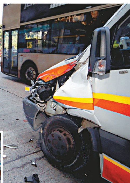
▲救護車狂撞停車落客的小巴，兩車分別頭尾損毀