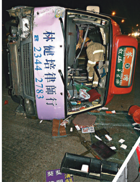
▲小巴撞斷燈柱後翻側，滑行近三十米才停下