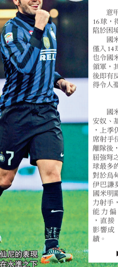
柏仙尼的表現明顯在水準之下