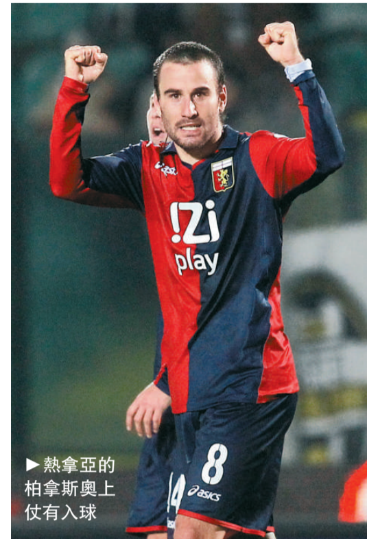
熱拿亞的柏拿斯奧上仗有入球