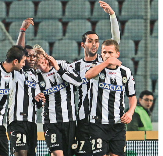
烏甸尼斯進佔意甲榜首