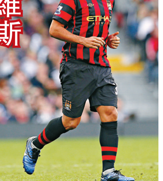
泰維斯去向仍未明朗

【本報訊】綜合外電英國十二日消息：AC米蘭欲羅致曼城「叛徒」泰維斯一事殺出「程咬金」，據英國《每日郵報》透露，曼城已初步同意法甲聖日耳門的超過3000萬歐元報價，如今AC只有寄望泰維斯本人拒絕聖日耳門，選擇來投聖西路。 據知AC米蘭副主席加利安尼曾就泰維斯之事，與前AC主帥、現任聖日耳門總經理李安納度通電話。李安納度透露，泰維斯屬意加盟AC米蘭，但後者希望以租借形式與曼城合作，曼城則希望正式把他出售。相信聖日耳門希望藉雙方的分歧，乘虛而入。 聖日耳門另一有利之處，是其老闆與曼城班主蒙扎份屬表兄弟關係，兩間球會隨時「閉門一家親」，不過相信若泰維斯不願意的話，也絕不介意用行動表達不滿。加利安尼也只能說一句：「只有盡一切可能的和不可能努力。」