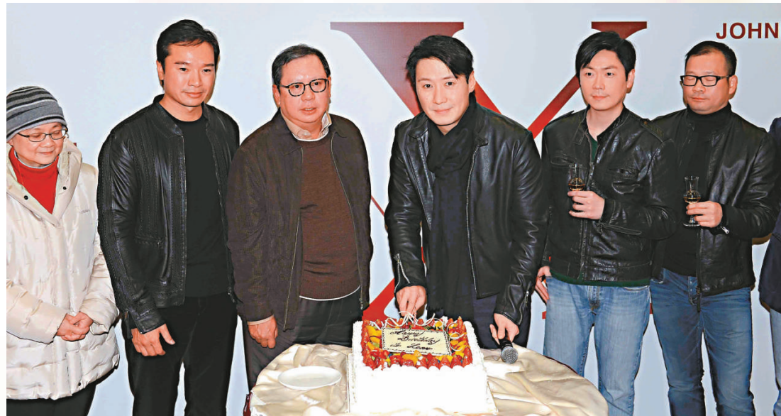
▲林建岳（左三）等人在後台為黎明（左四）慶祝生日