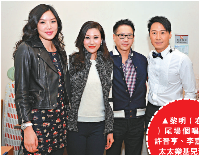
▲黎明（右起）尾場個唱，得許晉亨、李嘉欣和太太樂基兒到場支持