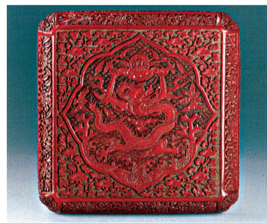
明萬曆剔紅天下太平雲龍紋方盒

香港東方陶器學會與香港中文大學文物館合辦的「雲行雨施——中國龍文物」專題展將於明年二月十一日至十月在中大文物館二號及三號展廳展出。文物館將提供接駁巴士，自港鐵大學站直達文物館正門入口，查詢可電三九四三三七一六。