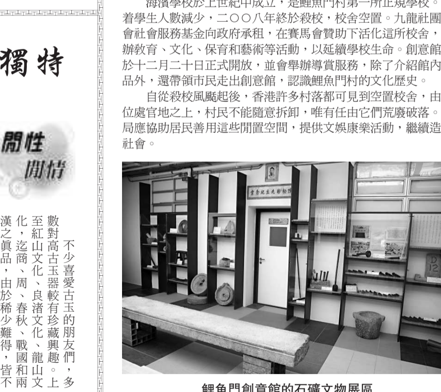
鯉魚門創意館的石礦文物展區

閒性閒情 不少喜愛古玉的朋友，多數對高古玉器較有收藏興趣。上至紅山文化、良渚文化、龍山文化，迄商、周、春秋、戰國和兩漢之真品，由於稀少難得，皆不勝枚舉。不過，唐代玉器則常遭一部分藏家忽視；有些人寧取宋代白玉件與宋仿高古玉器，其實，唐代除了玉佩飾（如玉簪、玉步搖、玉梳、玉鐲等）之類有實用價值的玉器外，玉質上乘與工藝卓越者應數那時雕琢的圓雕玉雕件（陳設品），裝飾性強，同樣甚富生活氣息及時代風格。筆者藏有一件唐代中期白玉跪俑（西域胡人樣貌和服飾），一件黃玉「飛天」與一件青白玉臥犬，皆可窺見那個時代玉器造型十分側重寫實；但形象鮮明獨特，跟那時期現實生活息息相關。