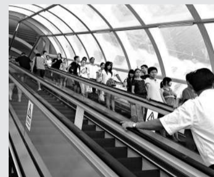
▲深圳北站地鐵換乘通道均已準備完畢，能容納大客流

「晉江經驗」的創造者晉江市，已連續18年領跑福建縣域，隨着經濟的增長，晉江將投入的重點放在了民生保障，特別是教育方面。從2006年春季起，晉江已經對包含外來工子女在內的九年義務教育階段學生實施免雜費政策，2012年還將安排免雜費補助資金1.36億元。