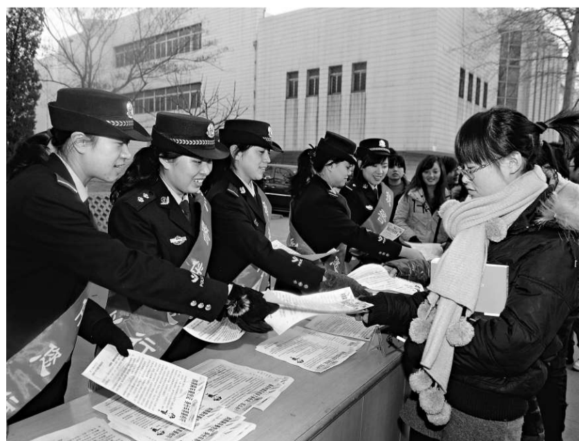
▲春運期間，內地鐵路將組織1.6萬名青年志願者，在164個車站爲重點旅客提供諮詢、購票、引導進出站等服務。圖爲太原鐵路公安局的民警12日向山西大學的學生發放宣傳資料