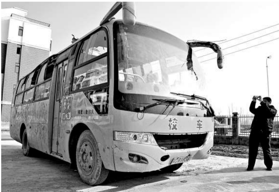
▲12日傍晚，江蘇豐縣首義鎮中心小學一輛專用校車發生側翻事故。截至13日凌晨，事故死亡人數升至15人。圖爲13日保險理賠人員對出事校車拍照

除了立即開展安全檢查，在13日的訪談中，黃毅還提出了包括建立校車安全准入的更加嚴格標準、