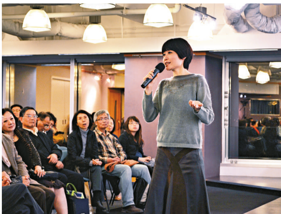
張曼娟在講座暢談百年來香港與文學家們的糾葛

張曼娟笑稱，很高興魯迅的看法和自己一樣。她說，香港其實是個充滿文學、藝術氛圍的地方，長久以來，外頭的人不太了解香港，而香港的人又太謙虛，常常低估香港。其實自己常常被香港許多小事驚喜。印象深刻的，一個是一九九五年張愛玲去世時，正值自己在香港小住，當時驚訝地發現香港大街小巷文學雜誌還是八卦雜誌把張愛玲放在封面，「這證明香港是有那麼多人，是知道、關心、並且在乎張愛玲這個作家的，我很感動。」第二次是發現二〇〇六年香港時代廣場舉辦的「魯迅是誰」展覽，雖然只有短短兩周，卻有超過五十萬香港民衆觀看。「這才是香港」，張曼娟說。