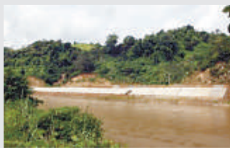
▲越方剛剛修建竣工的河堤

記者從河口縣了解到，縣裡曾於2006年將上述情況及其後果上報了省級部門，在一份雲南省委的批覆意見中，記者看見