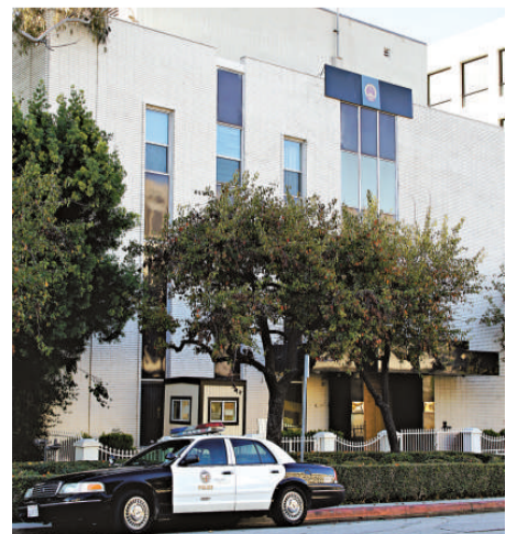
▲洛杉磯警方16日加派警力保護中國總領事館 中央社

據華文媒體從業人員回憶，大約數月前，也曾接到一位張先生投訴，當時他在電話中告訴媒體，說自己多年來一直到處遭政府「追殺」，美國政府非常腐敗不保護他，導致他到處逃難，最後躲到華人較少的拉斯維加斯。