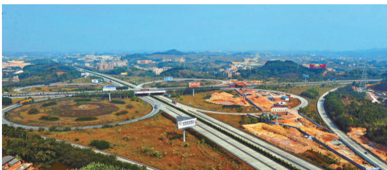
▲2011年1月1日，時值中國—東盟自貿區成立一周年。隨着「南新走廊」沿線工業基地、商貿基地、物流基地和信息基地的逐步建立，在「南新走廊」沿線正在崛起一條經濟增長帶。圖為廣西南寧市環城高速公路