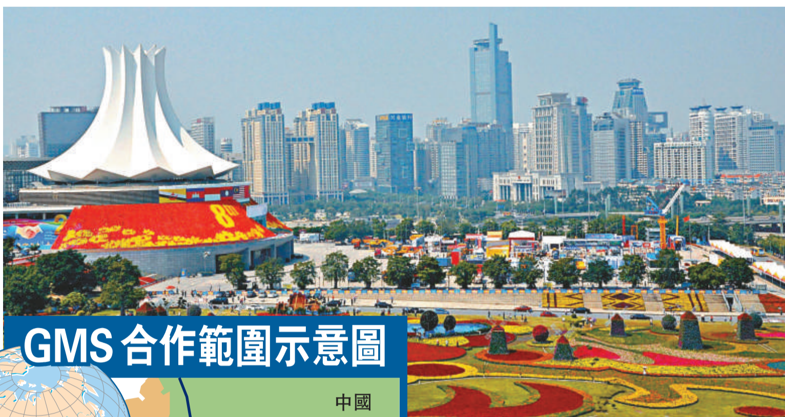
▲中國廣西南寧10月份舉辦第8屆中國—東盟博覽會、中國—東盟商務與投資峰會 資料圖片

2012年，廣西將加快航空物流大通道建設，努力打造三個航空物流中心：在南寧空港城項目的基礎上，將南寧打造為中國乃至亞洲最大的水產品集散中心、水果和特色農產品集散中心，將桂林打造為面向珠三角和長三角的物流轉運中心。