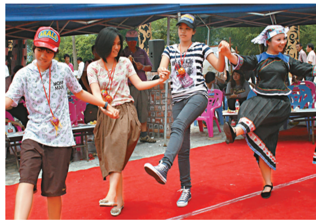
◀中國青年和東盟青年在廣西聯歡，手拉手翩然起舞 資料圖片

2012年12月，第四次領導人會議將在緬甸內比都舉行，審議確定未來十年的合作戰略框架是此次會議的重要議題。17日發布的報告稱，中國願與GMS各成員國一道落實好各項合作協議，推動各領域合作向新的深度和廣度發展，為實現GMS各國的共同發展與繁榮作出積極貢獻。