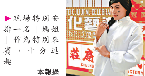
▶現場特別安排一名「媽姐」作為特別來賓，十分逗趣