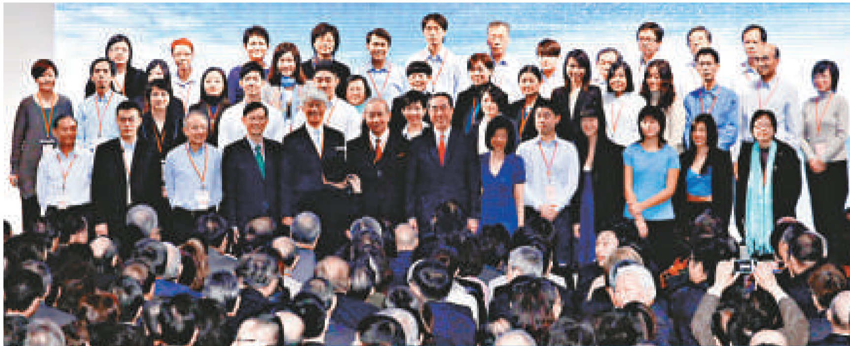
△唐英年及其競選團隊合影