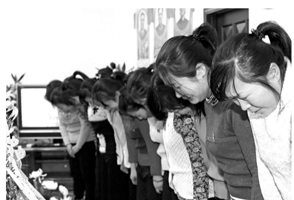
▲19日，朝鮮瀋陽總領事館駐丹東支部，為17日逝世的朝鮮最高領導人金正日舉行弔唁儀式，約有2300餘各界人士出席

。」 張璉瑰又認為：「任何新掌權者，都會首先把主要精力投入到內部事務處理中，短時間內來不及出台具體的外部政策，因而中朝方面的政策需要一定時間之後才有可能出現變化。」 「金正恩只是一個二十多歲的年輕人，他現在是否有完整的對華政策方案還很難說。即使他可以通過貨幣改革等措施穩定國內局面，但對外政策如果走錯一步的話就可能面對非常嚴重的挑戰。」 「因而在他真正掌權之前以及掌權之後的一定時間內，朝鮮對華政策應該不會出現什麼新的變化。」張璉瑰估計，半年之內，中朝關係不會發生實質性變化。