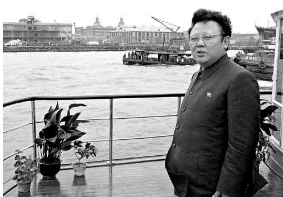
▲1983年6月8日，金正日在上海乘船遊覽黃浦江

到了去年，金正日訪華頻率明顯提高。從2010年5月至2011年8月一年多的時間內，四次訪華。2010年5月3日至7日，金正日對中國進行非正式訪問，並在北京、天津、遼寧等省市參觀考察。中共中央政治局九常委也均出席了有關會見或陪同活動。同年8月26日至30日，金正日時隔三個月再次對中國進行非正式訪問，並在吉林、黑龍江兩省參觀考察，胡錦濤前往長春會見了金正日。