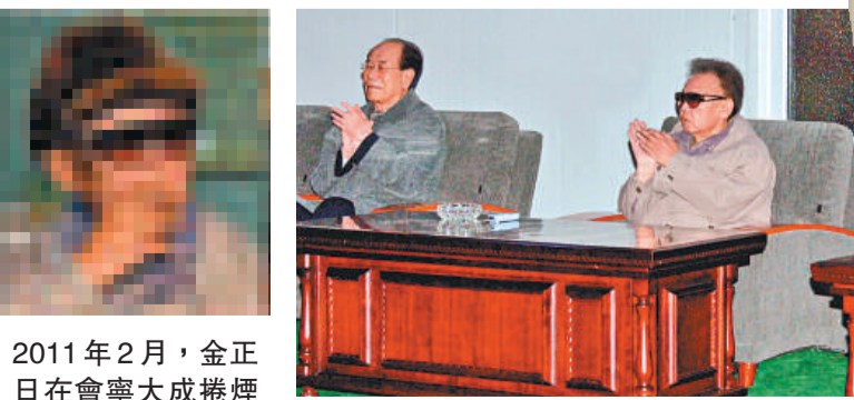
2011年2月，金正日在會寧大成捲煙廠內吸煙

金正日2001年曾因健康原因而戒煙，但從2009年朝鮮電視畫面上出現的煙灰缸來看，他應該是重新開始吸煙。2009年紀念金日成誕辰97周年的焰火晚會，金正日面前的桌子上擺放着煙灰缸