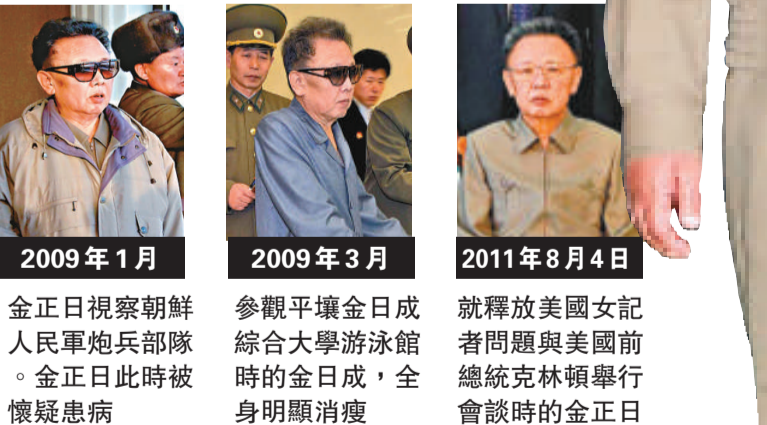
2009年1月 金正日視察朝鮮人民軍炮兵部隊。金正日此時被懷疑患病 2009年3月 參觀平壤金日成綜合大學游泳館時的金正日，全身明顯消瘦 2011年8月4日 就釋放美國女記者問題與美國前總統克林頓舉行會談時的金正日

金正日就連戒煙也在朝鮮造成一股風潮。韓國媒體曾報道，金正日戒了煙，還大聲高呼：「21世紀有三種人是笨蛋，一種是抽煙的人，一種是不懂電腦的人，一種是不懂欣賞音樂的人」，朝鮮立刻掀起全國反煙運動。路透社