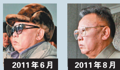
2011年6月 2011年8月 臉頰：慢性腎功能不全導致臉頰黑斑擴大