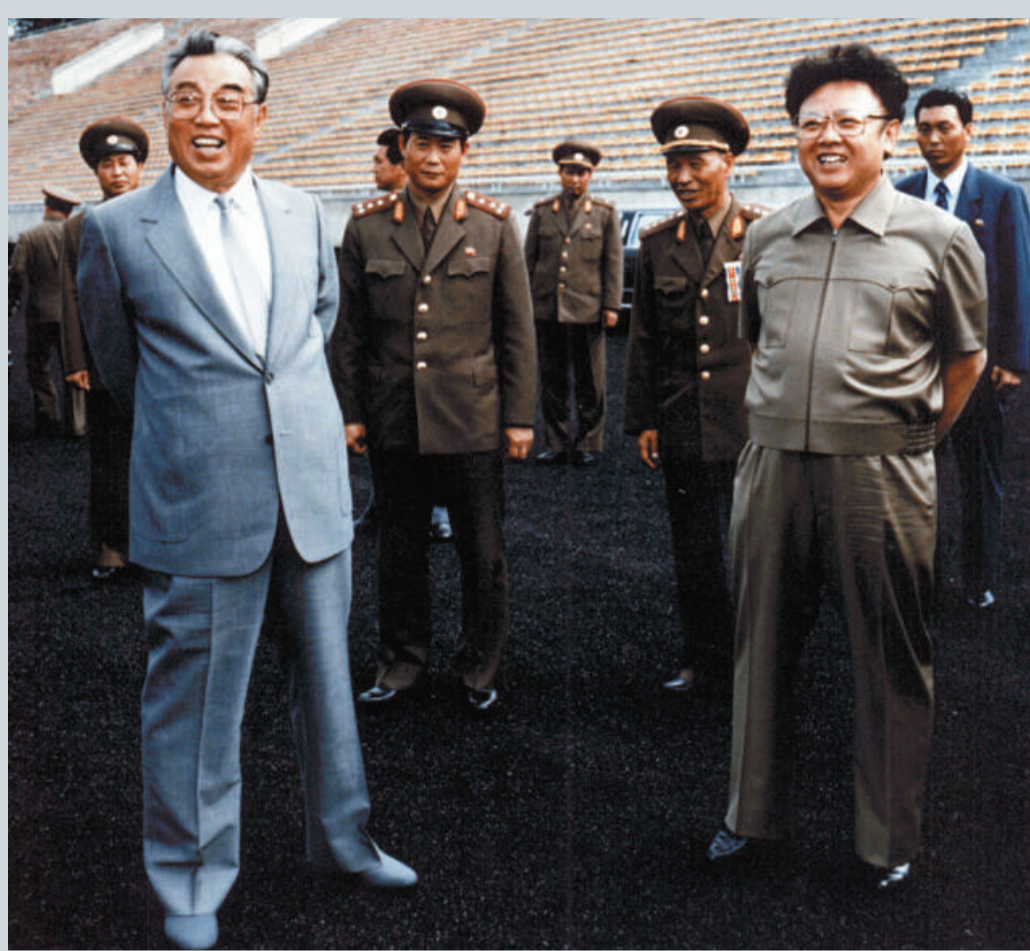
▲1992年，金正日（右）與父親金日成（左）視察平壤一個足球場

擔任朝鮮領導人近20年的金正日在很多時候非常神秘，與絕大多數世界領導人相比，金正日會見的來賓相對較少。有很多關於金正日參觀軍事基地、考察礦業企業以及出席文化活動的照片，但視頻影像卻很少，而且他的聲音資料從未在朝鮮以外的地方公開過。朝鮮民眾也只是在廣播上聽過一次他的講話，那是1992年，當時他在集會上說，光榮屬於英勇的人民軍。