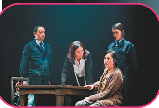
◀《關·愛》演活獄中母女情