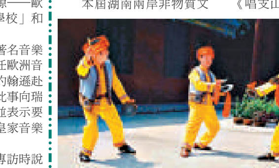
▲土家族打溜子是湖南湘西土家族地區流傳最廣的一種古老的民間器樂合奏。演奏樂器有溜子鑼、頭鼓、二鼓、馬鑼等

此次湖南非物質文化遺產項目赴台舉辦展覽、展演，是全國首次由單個省份組織的兩岸非物質文化遺產交流，也是兩岸開放交流二十多年來赴台規模最大、持續時間最長的非物質文化遺產交流活動。 本屆湖南兩岸非物質文化遺產月活動以「楚風湘韻」為主題，主要包括「楚風湘韻——湖南民藝民俗特展」、「楚風湘韻——兩岸民間樂舞專場演出」和「保護、傳承、弘揚——兩岸非物質文化遺產論壇」三項內容。其中，「楚風湘韻——兩岸民間樂舞專場演出」在台北開展為期一個月的展演交流活動。