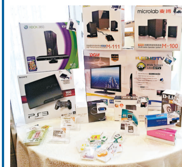
▲電腦節中最常見的手提電腦及周邊產品

【本報訊】實習記者阮靈峰報道：香港電腦業協會繼二月及八月，再在本月底舉辦電腦節，日期由本月二十七日至下月二日，地點是灣仔電腦城，以及深水埗的黃金電腦商場、高登電腦中心和高登電腦廣場，屆時將有多種電腦產品以優惠價銷售，當中包括電腦及周邊產品、高清電視及機頂盒、遊戲機等。