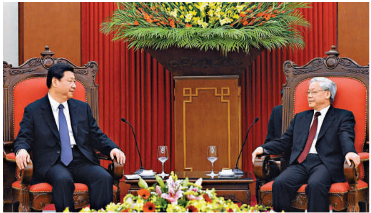
▲習近平21日在越南河內會見越共中央總書記阮富仲

會談前，黎鴻英和阮氏綠在主席府為習近平舉行了歡迎儀式，儀仗隊禮兵和少年兒童在門前列隊歡迎中國代表團一行。會談結束後，雙方共同出席了兩國有關經貿、衛生、新聞等領域合作文件的簽字儀式。