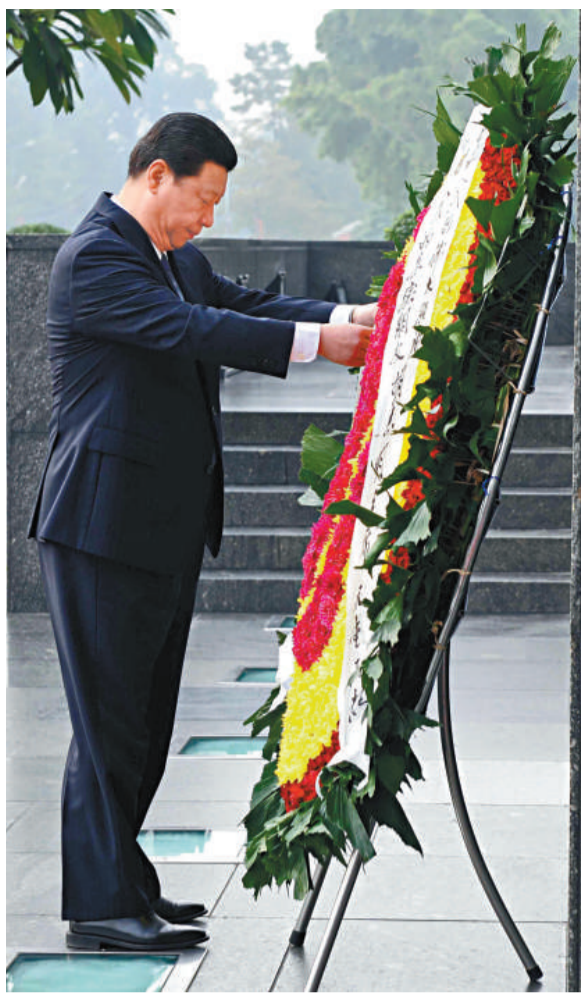
▲習近平21日到已故越南國父胡志明的陵墓敬獻花圈

訪問期間，習近平將會見越共中央總書記阮富仲、國家主席張晉創、政府總理阮晉勇、國會主席阮生雄，並同越共中央書記處常務書記黎鴻英和國家副主席阮氏綠舉行會談，就深化中越兩黨兩國關係和共同關心的重大國際地區問題交換意見。