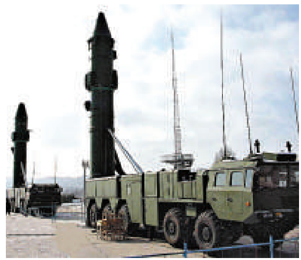
▲中國中程彈道導彈「東風21C」

軍事專家郭宜認爲，爲提升戰略威懾能力和戰術打擊能力，解放軍仍未停止用新型固體燃料導彈替換老式液體燃料導彈的進程。作爲核力量的一部分，中國早已部署了中程彈道導彈，並且正在擴大非核導彈的武器庫。如果需要，這些導彈均可將印度、日本、韓國和東亞地區美軍等目標作爲打擊對象。