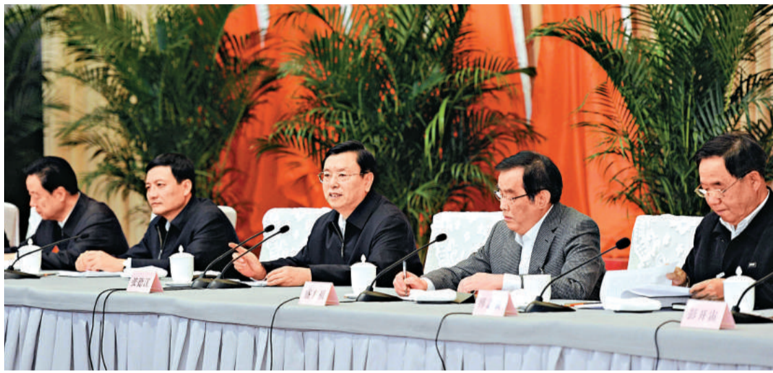
▲23日，國務院副總理張德江在北京出席全國鐵路工作會議並講話

盛光祖說，要科學有序推進鐵路建設。根據「十二五」規劃和資金情況，2012年安排固定資產投資5000億元，其中基本建設投資4000億元，新線投產6366公里。要保證重點工程建設順利進行。按照「保