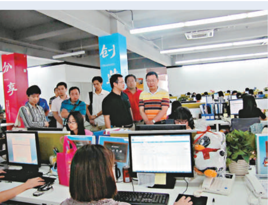
▲國務院常務會議提出要重點研發下一代互聯網關鍵芯片、設備、軟件和系統。圖為廣州的互聯網產業園