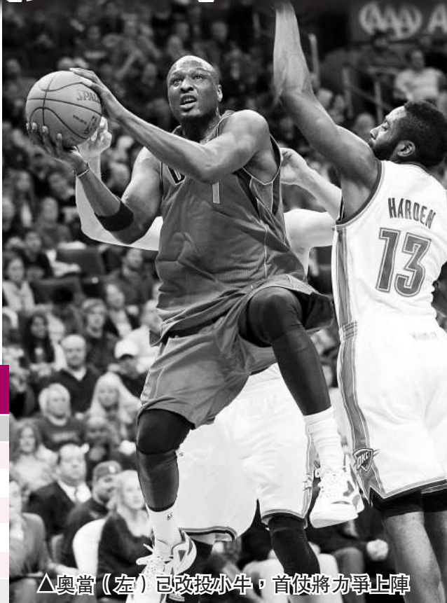
△奧當(左)已改投小牛，首仗將力爭上陣