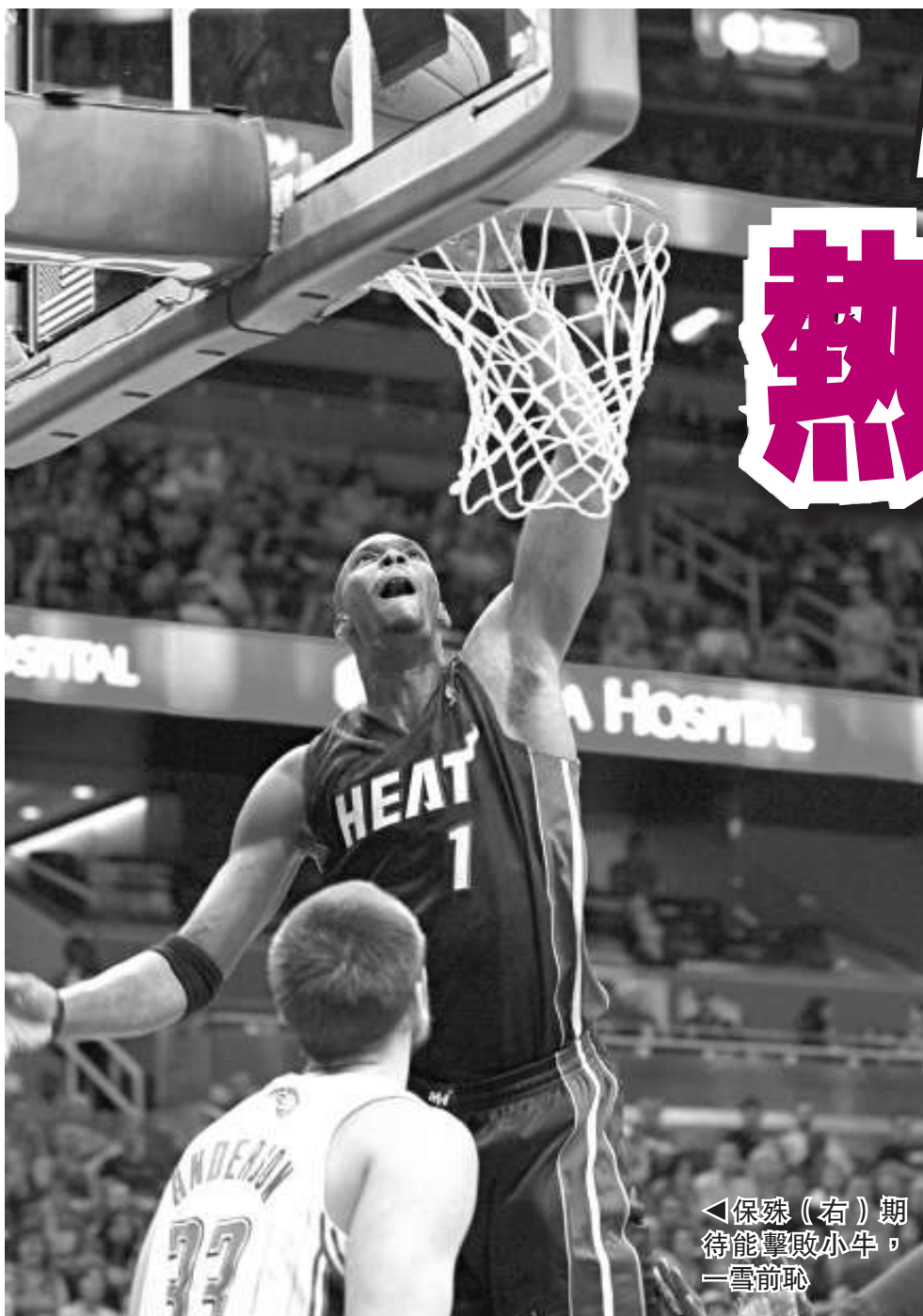
◀保殊(右)期待能擊敗小牛，一雪前恥