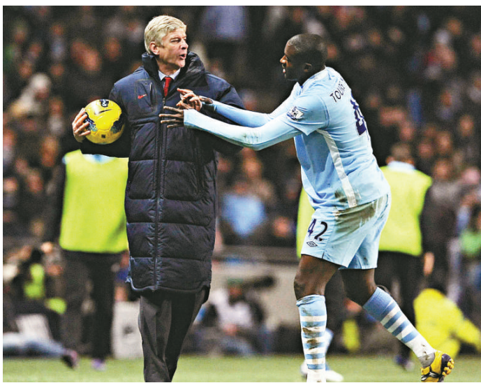
▲ 由雲加（左）帶領的阿仙奴，已重返英超前列位置

不過，阿仙奴最急需增兵的位置是左後衛，安德里山度士、基爾基比斯及佐羅都有傷在身，右後衛的沙格拿及贊堅臣則因傷而復出無期，故雲加希望借用不獲重用的前英格蘭腳布歷治。