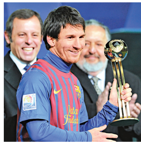
▲ 美斯奪獎拿到「手軟」，他早前已榮膺世界冠軍球會杯最佳球員

【本報訊】綜合外電法國二十四日消息：效力西甲班霸巴塞隆納的阿根廷前鋒美斯，周六獲法國權威體育報章《隊報》選為本年度「冠軍中冠軍」。美斯今次是力壓網球「一哥」、塞爾維亞的祖高域及世界一級方程式盟主、德國的維特爾當選。