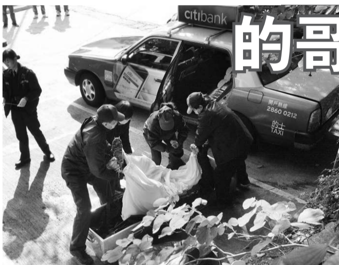
事主節日感淒涼輕生，屍體由仵工昇往殮房

昨日中午十二時三十分左右，丈夫返家發現，妻子在家中燒炭陷昏迷，叫拍已無反應，立即報警求助；救護員趕到，將莫婦送院施救後返魂無術。警員在現場檢獲一封遺書，初步相信女死者與丈夫感情生變，不堪婚姻破裂困擾而輕生，案件無可疑，屍體稍後由仵工昇往殮房。