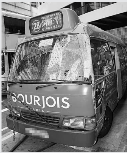
小巴滾了幾圈向左翻側，車頭擋風玻璃破裂

【本報訊】中環德輔道中昨午發生大巴撞翻小巴意外，一輛小巴從畢打街駛出路口時，被馳至雙層巴士猛撞失控，滾了幾轉才停下，幸車上無載客，兼逢聖誕假少途人，未有禍及無辜，意外中僅兩司機受輕傷。警方正調查是否涉及衝紅燈釀禍。