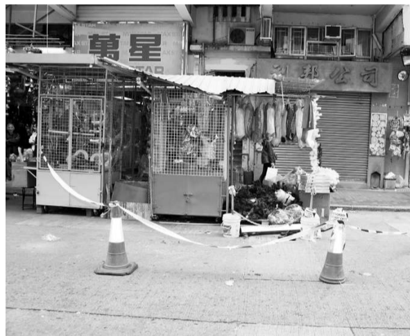
男子從大廈7樓天台躍下，因簷篷卸力只重傷

玩具檔女檔主在事發前一刻，剛離開檔口往用膳，得以避過一劫；她事後表示，如被壓中非死即傷，只造成檔口簷篷損毀，已是不幸中之大幸，又指換作是前日平安夜最多人購物時，後果更加嚴重。