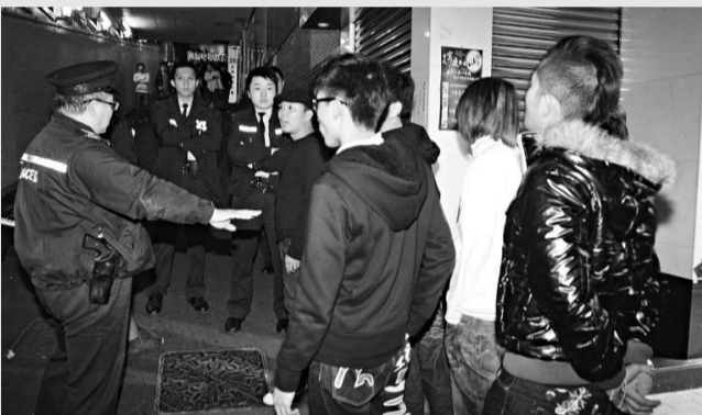
約十名大漢趕到，警方為防「搞事」阻止登樓

警方事後一度全線封閉德輔道中，意外原因待查，將會翻看附近閉路電視，有否拍下撞車經過，現正了解是否有人衝紅燈釀禍。現場交通一度癱瘓，在警員清理現場後恢復正常。