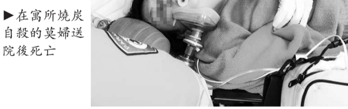
在寓所燒炭自殺的英婦送院後死亡