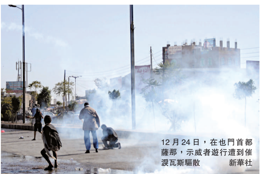
12月24日，在也門首都薩那，示威者遊行遭到催淚瓦斯驅散

今年1月底，也門各省陷入動盪之中。與其政治和經濟往來十分密切的海合會4月提出了旨在化解也門危機的調