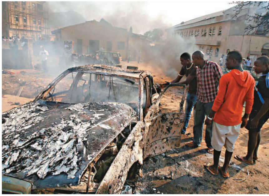
▲圖為尼日利亞聖特蕾莎教堂外的爆炸現場

近日尼日利亞東北部3個城市曾發生被指是該組織製造的襲擊事件，其後軍隊大力鎮壓，造成多達100人死亡。這3個城市過去曾發生多宗被指與「博科聖地」有關的暴力事件。