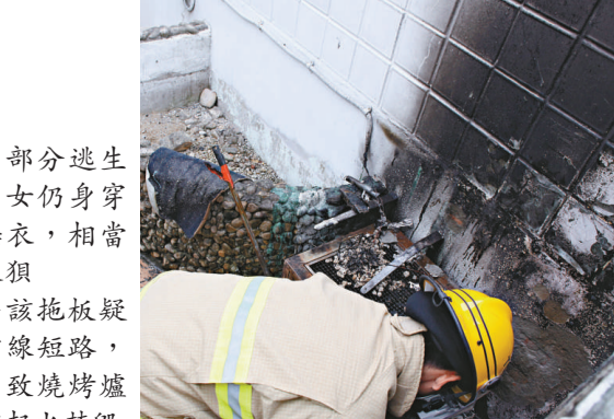
▶該拖板疑電線短路，引致燒烤爐突起火焚毀