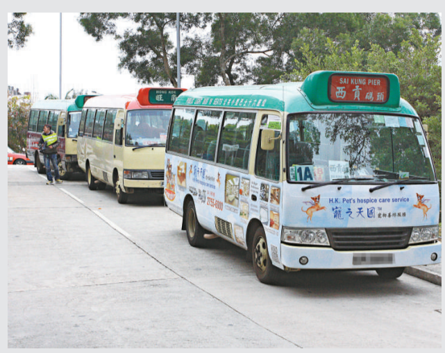
▲三小巴連環首尾相撞，分別車頭車尾損毀