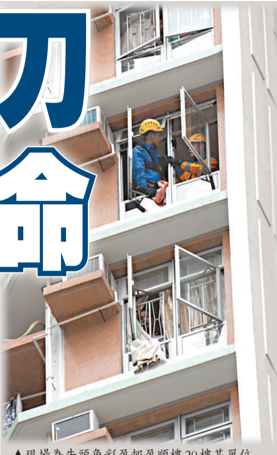
▲現場為牛頭角彩盈邨盈順樓20樓某單位

及至早上十一時四十五分，先由消防員動手破門，穿「鐵甲威龍」裝備的警員即衝入，很快將失常漢制服拘捕，救出女傷者送往聯合醫院救治。被捕男子亦報稱受傷，並因情緒激動，在鎖上手銬及用布條捆綁雙腳後，由擔架床送院檢查，鬧劇擾攘四個多小時終結束。