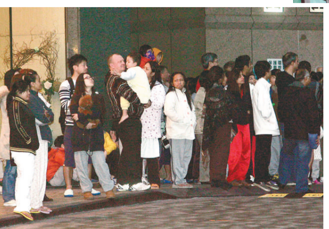
▲部分逃生男女仍身穿睡衣，相當狼狽

電工師傅指出，電器短路的原因很多，較常見是電器內部電線的絕緣包殼損爛；此外，電器變壓器的內線圈過熱，也可導致絕緣物料失效引起短路。現時不少住屋單位，都加裝了漏電斷路器（簡稱RCD），有助減少家居火警。但市民要注意使用電器安全，平日應避免有水濺入電器內；另要定期除去電器外殼灰塵，天氣潮濕時要做好防潮措施。