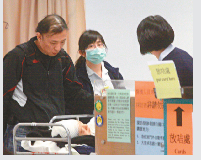
▲病婦在過關時一度聲稱被人斬傷

尾車小巴上司機和四男女乘客撞傷頸部或腳部，夾在中央變「三文治」的紅色小巴上，也有一名男乘客後腦撞傷，共六名傷者分批由救護車送往醫院治理。其他乘客飽受虛驚，自行轉乘其他車輛離開。