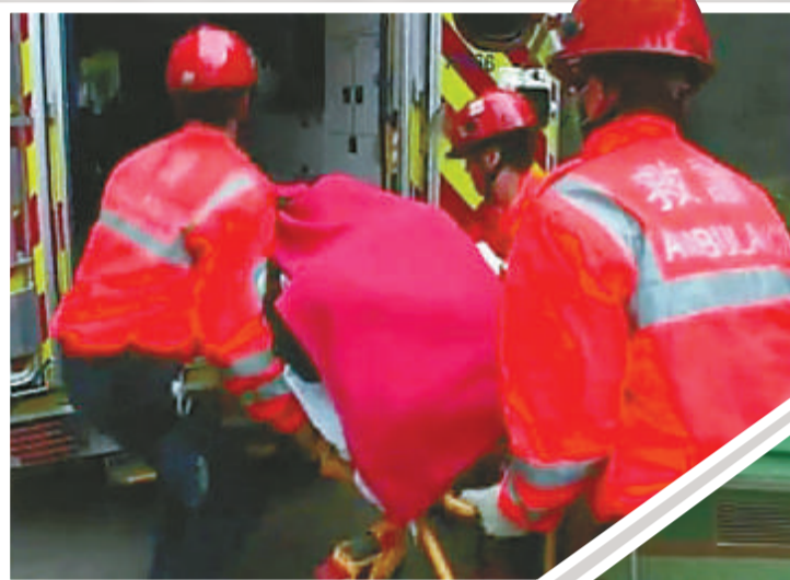
▲警方救出女傷者送往聯合醫院救治 ▶消防員需在地下張開救生氣墊，防男子跳樓

警員接報馳至，但屋內男子拒絕開門，並走近窗邊危立，消防員需在地下張開救生氣墊防範。對峙期間，男子把電話、枕頭等多樣物件亂擲落街，幸無人受傷。警方多名談判專家稍後到場游說，因懷疑男子受藥物