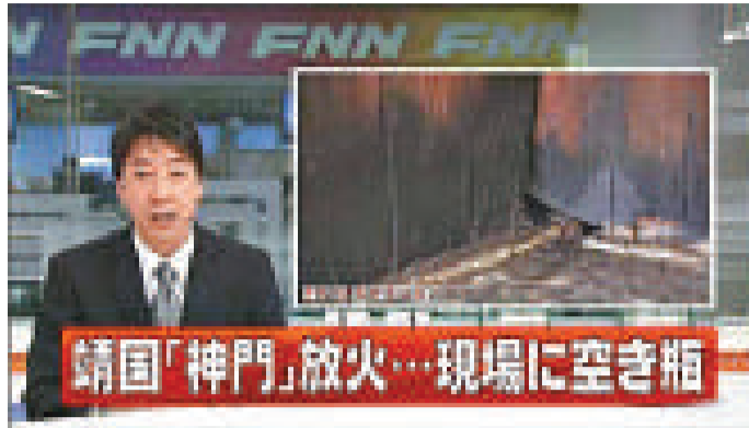
日本電視台播出靖國神社被縱火的畫面，右圖為大門下部有燒焦的痕跡

【本報訊】據中新社東京26日消息：12月26日凌晨4點10分左右，東京都千代田區九段北的靖國神社內的一扇大門着火，保安發現後隨即