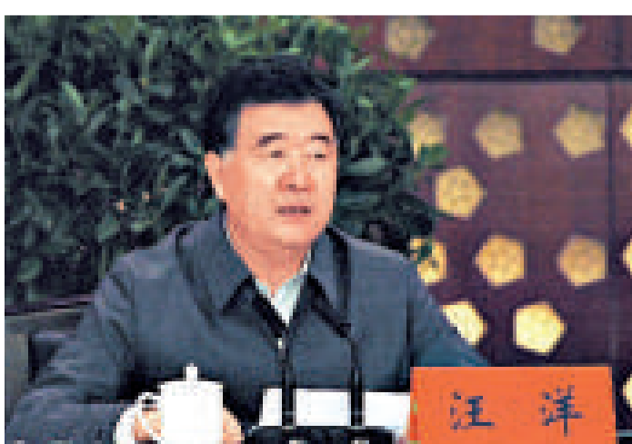
▲二十七日，廣東省環境保護工作會議在廣州召開，省委書記汪洋出席會議並作講話

【本報訊】廣東省環境保護工作會議27日在廣州舉行，廣東省委書記汪洋27日在大會發言中指出，廣東要加緊做好增加PM2.5監測指標的準備，並在珠三角率先將PM2.5納入空氣質量評價體系。接下來廣東將大力建設民主環保，鼓勵發展民間環保組織。