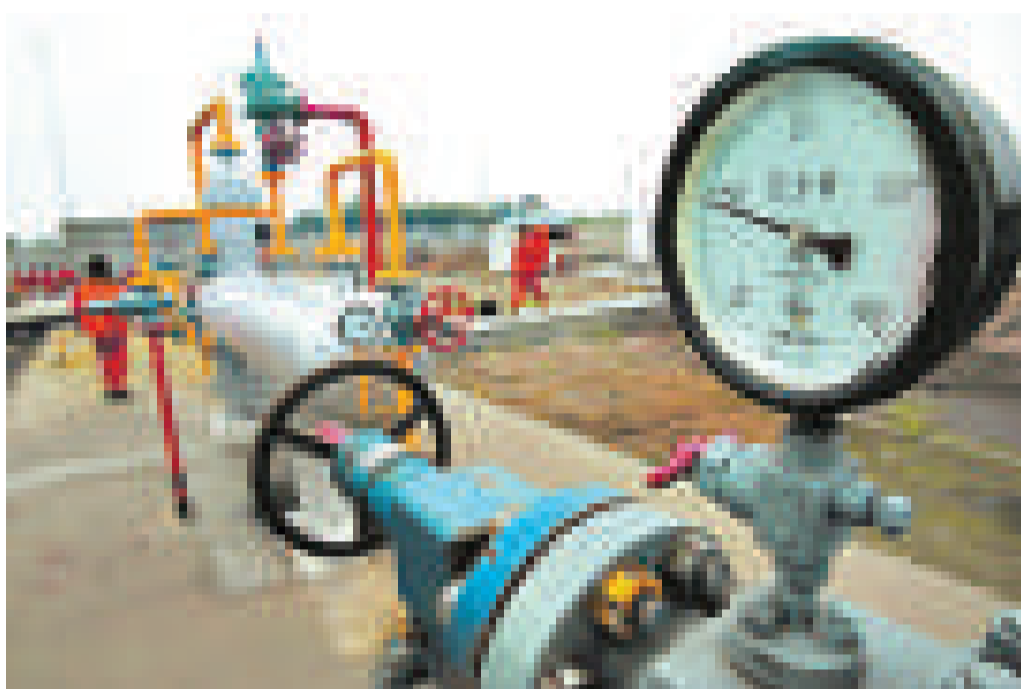
中國在廣東省、廣西壯族自治區開展天然氣價格形成機制改革試點 資料圖片