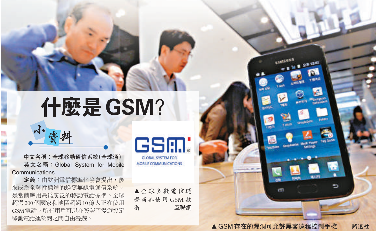
▲ GSM存在的漏洞可允許黑客遠程控制手機

參與調查的共有11個國家的32家電話公司，並根據他們能否輕易攔截這些公司的電話、能否輕易侵入某人的手機或追蹤某人的手機等，來對它們進行排名。諾爾說：「這些公司都沒有很好地保護用戶的安全。」