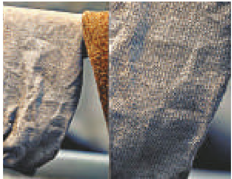
▲英國襪子上驚現耶穌肖像 英國《每日電訊報》

了，但你仍舊可以看出耶穌的頭像。」這隻襪子是人們從日常生活的用品中發現所謂「耶穌神跡」的最新證據。