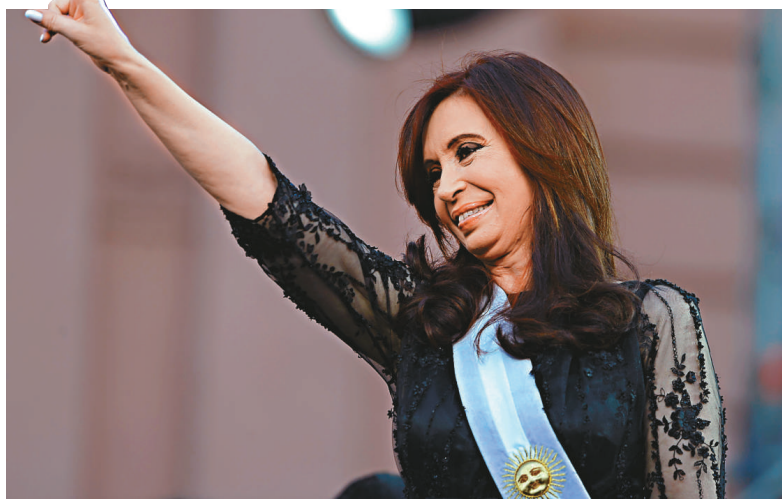
▲阿根廷總統克里斯蒂娜

斯科奇馬羅說，阿根廷總統府醫療小組在本月22日對克里斯蒂娜進行常規體檢時，在她的甲狀腺右葉發現了癌細胞。醫生經過進一步的化驗和研究之後，決定在明年1月4日為克里斯蒂娜實施外科手術。