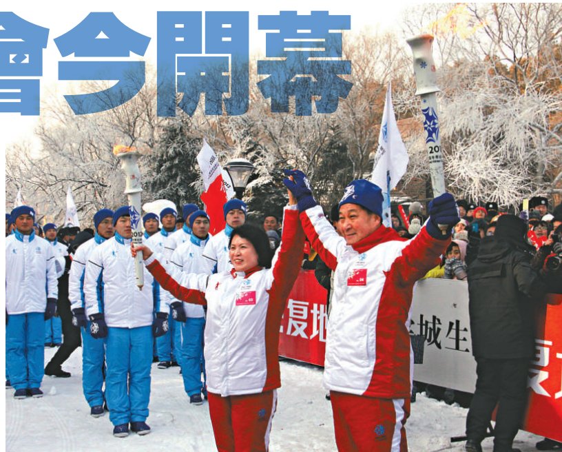
▲全國冬運會聖火傳遞活動現場

當日共有11名火炬手進行了傳遞，他們當中有奧運冠軍、世界冠軍的啟蒙教練、優秀基層體育工作者、「健康長春人」代表、中國大學生自強之星標兵等。