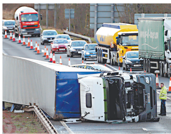
▲ 蘇格蘭有貨車被大風吹倒翻側