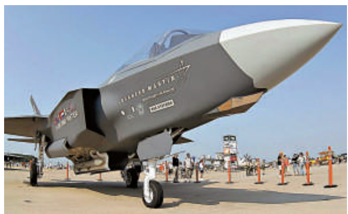
▶ 洛克希德馬丁公司生產的F-35戰機

【本報訊】據路透社華盛頓4日消息：美國國防部長帕內塔定於周四發表最新一份戰略性軍事檢討報告，料會建議國防部在未來數年內削減預算開支，並減少在歐洲的駐軍。這份報告也會建議美國，放棄一向以來致力維持軍力在同一時間應付及打贏兩場戰爭的目標，取而代之是集中火力，打贏一場大戰。