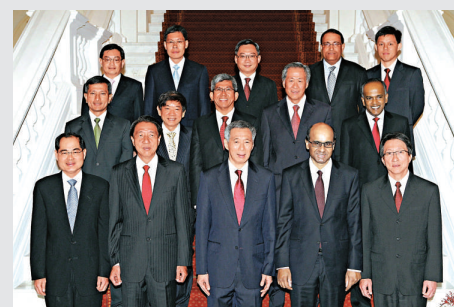
◀ 新加坡內閣集體減薪

【本報訊】據《星洲日報》4日報道：新加坡總理及局長將削減三分之一薪額，以回應民間的質疑，但他們仍是全球最高薪酬的高官。