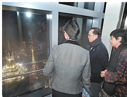
曾蔭權等從上海環球金融中心遠眺黃浦江兩岸的景色