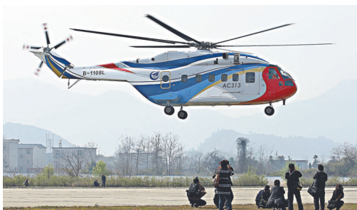
▲AC313大型民用直升機獲頒合格證，成為世界上第一型取得4500米海拔地區A類適航證的民用直升機

由中國航空工業集團公司自主研製的13噸級AC313大型民用直升機，昨日獲得中國民用航空局頒發的型號合格證，標誌着這款亞洲最大噸位直升機成為世界上第一型取得4500米海拔地區A類適航證的民用直升機。