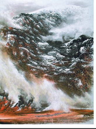
▲朱頌民油畫作品《牧歸》

主辦方表示，三十五歲前後，是青年美術家藝術生涯的關鍵階段，敏銳的感覺、飽滿的熱情、活躍的思想以及充沛的精力是這個階段美術家的優勢。本次舉辦青年美術作品邀請展，向觀眾展示廣東省二十一個地級市美術家的作品，希望引起各界對青年美術家的關注，見證他們的成長。