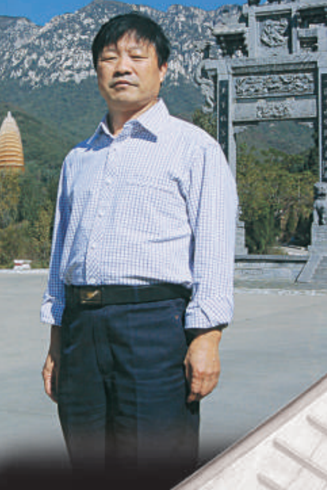
▲睢根尚創乾坤同體書法，自成一家