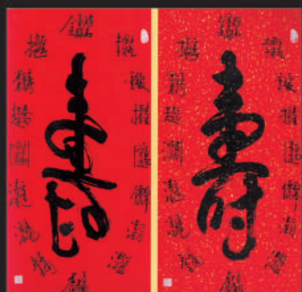
▲《八仙祝壽》書法一對，壽字周圍為八言詩，每兩組字含一言