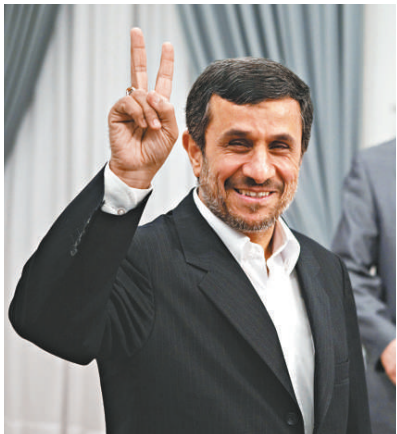
▲1月5日，伊朗總統內賈德（左）在德黑蘭做出勝利手勢

不過，中國中東問題專家殷罡表示，儘管伊朗有意地在美國後院做一些政治遊戲，但是無法對美國構成任何威脅。