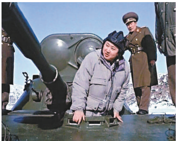
▲1月8日，朝鮮國家電視台播放了金正恩駕駛坦克的畫面

【本報訊】據中通訊社、韓聯社8日消息：朝鮮國家電視台8日播放了一段朝軍舉行演習的錄像，錄像中有朝鮮繼任領導人金正恩駕駛坦克以及他視察射擊演習等畫面，展現金正恩從未公開示人的一面。