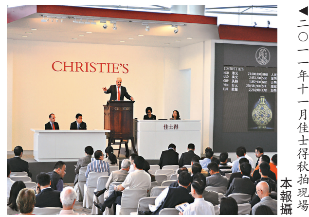
▲ 二〇一一年十一月佳士得秋拍現場