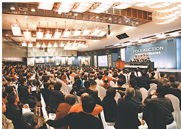
▲ 二〇一一年十二月北京保利秋拍現場

藝術品收藏的本質，是讓人修養身心的，然在今天的經濟環境下，已變成赤裸裸的投資產品，吸引眾人參與投機。凡提到某件藝術品，人們必然只會說到其價格，似乎價格已替代了藝術品的全部價值，這是非常荒謬的。