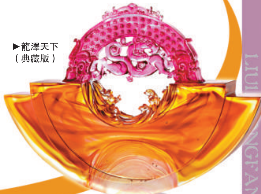
▶ 龍澤天下 (典藏版)