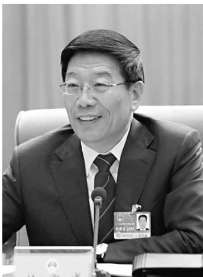
▲湖南省委副書記、省長徐守盛

在從東部江蘇調至西部甘肅任省長多年的徐守盛調任湖南省委副書記、省長後，深知中央中西部戰略布局的重要，為此，徐守盛將工作的着重點放在推進中西部戰略上，着力推進科學發展，改善民生。