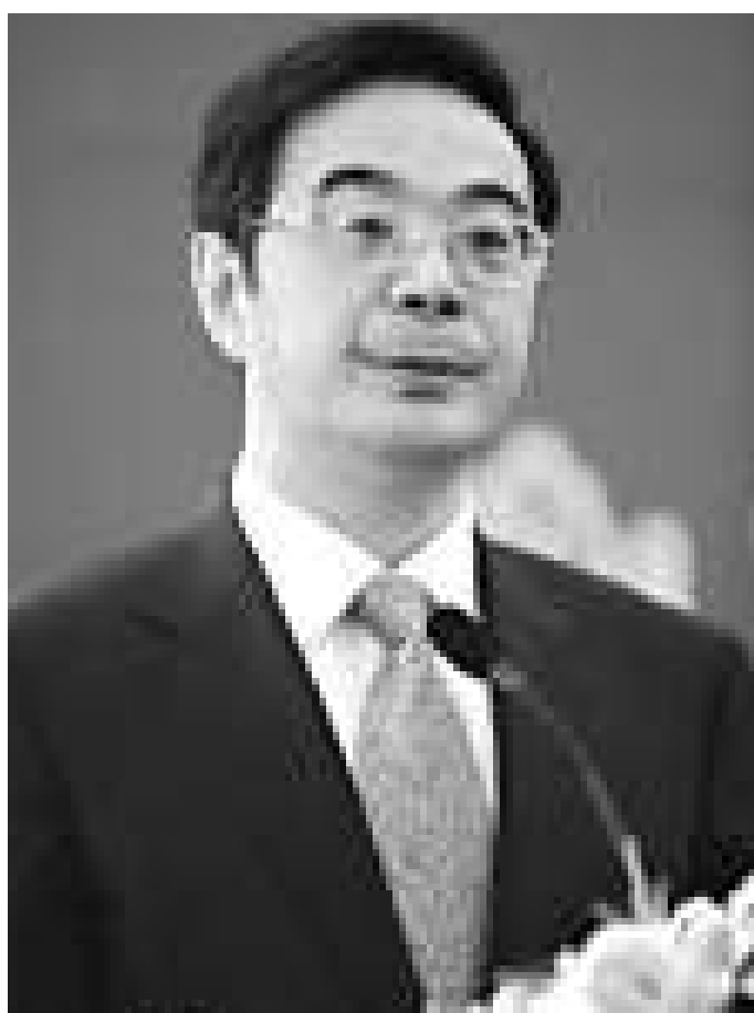
▲湖南省委書記周強

從2006年第九次黨代會的「富民強省」，到2011年第十次黨代會的「全面小康」，在湖南省第十次黨代會上，湖南省委書記周強發表的主題為「堅持科學發展，推進四化兩型，為加快實現全面小康而奮鬥」的報告，描述了新藍圖，未來5年湖南跨越式發展令人憧憬。