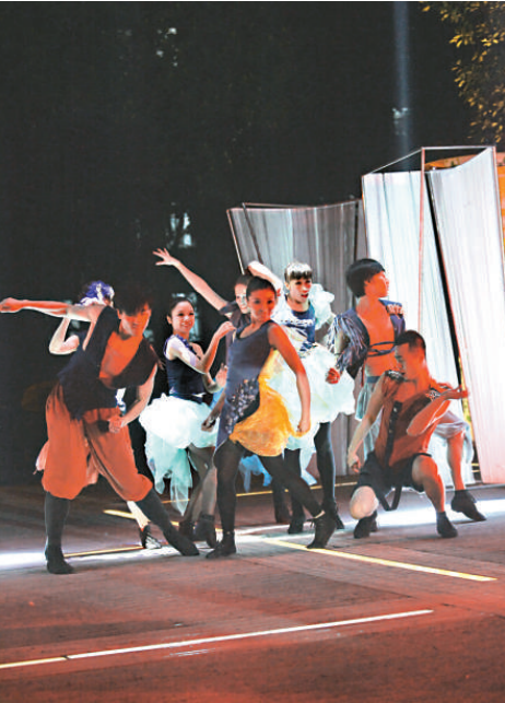
▲雲娜舞蹈團在演出