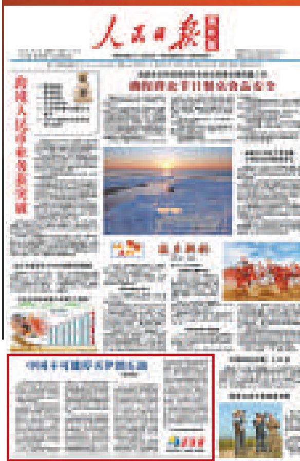
人民日報海外版頭版刊文《中國不可能買伊朗石油》