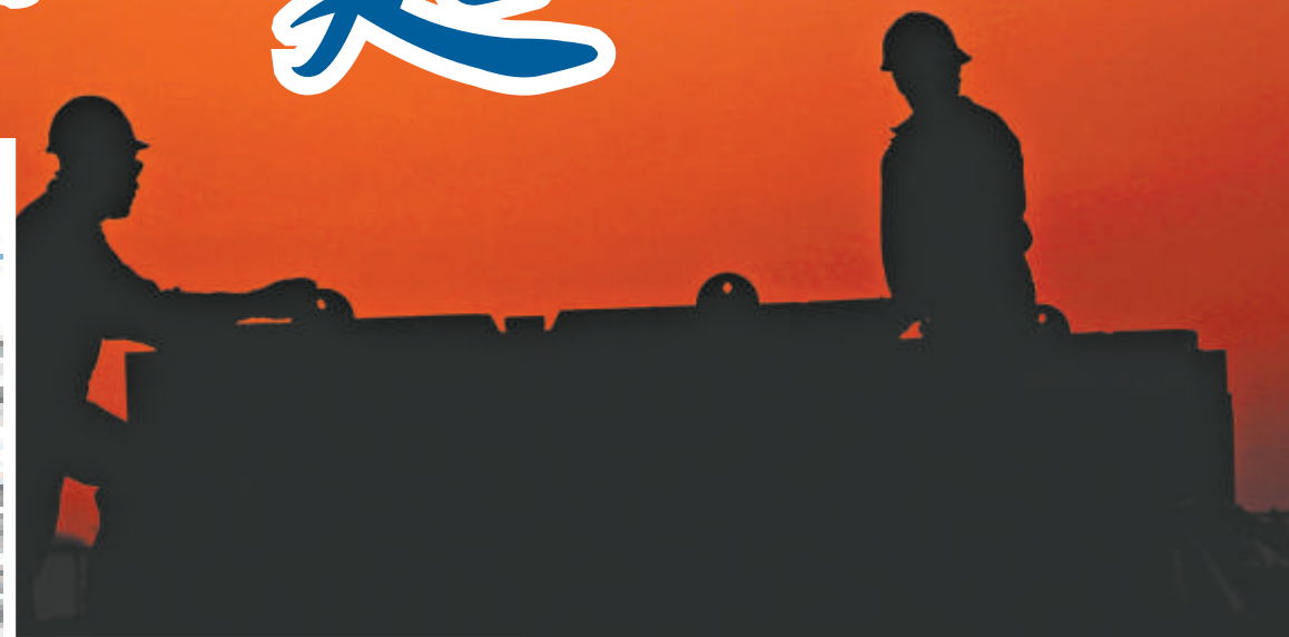
伊朗石油工人在夕陽下工作