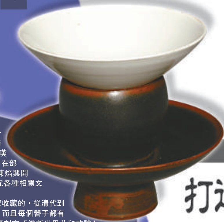
黑釉盞托 白釉盞 宋