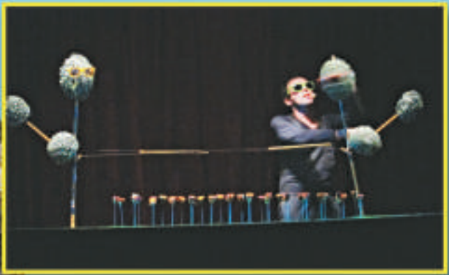
▲木偶戲《賈斯敏的神秘花園》的演出場景 ▲用作放映電影紀錄片等活動的竹棚「拾穗館」夜景內觀

藝穗節的特色在於生活化、創意、活力和另類，有助加強城市族群的歸屬感。這對於移民城市深圳，特別是新開發的南山區來說，有助建立區內文化根基。今年第二屆，可見這項活動不僅能刺激區內經濟消費，亦廣受市民歡迎。在現今政府撥款有限，拓展商業贊助又必須謹慎小心的情況下，面對一年較一年要求更高的觀眾，藝穗節在深圳仍可繼續舉辦多少屆呢？