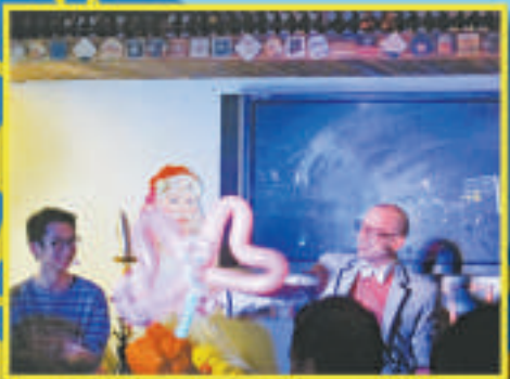
▲加拿大藝人(右)邊玩魔術邊講笑話

劇《戀愛輕飄飄》、R&T (Rhythm & Tempo) 演出的《腳踏瘋城》、藝穗劇實驗室演出的《都市男女》、默寄默劇團的《Defile 歡樂之旅》等等。可以說，香港的節目佔了大部分，且全是現代城市文化品味的節目，借助鄰近香港的優勢來打造深圳的城市文化，亦順理成章。