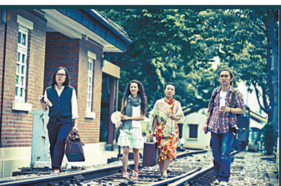
▲《鐵道緣》於鐵路博物館實地演出

在構圖上，鄭旭彬將點、線、面有機結合，運用平面構成的原理，使畫面產生強烈的視覺衝擊力；近乎機械的點、乾筆的塊面，是現代社會工業化的一個特徵。通過一系列更趨鮮活、鄭旭彬的畫面更趨鮮活，無論是垂釣的老者，還是勞作的耕夫，抑或顧影自憐的村姑，都能勾起觀眾一些記憶。