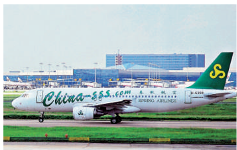
▲春秋航空獲國開行貸款支持，將用於5架空巴A320-200全新客機的短期預付款和長期融資安排