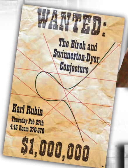
▲BSD猜想難題懸賞100萬美元 互聯網