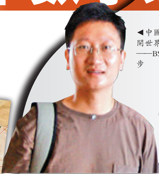
▼數學界仍有很多難題待攻克 互聯網

為挑戰懸賞100萬美元的這一問題，冬季學校已經不晝夜。參加人員每天都拿拿到必須解決的數學問題，這樣，他們自然地形成了解決BSD猜想的國際網絡。此外，在舉行冬季學校期間還有讀者寫出自己的答案送來等，一般民眾對此也十分關心。浦港工大還將於2013年及2014年舉辦冬季學校來挑戰懸賞100萬美元的BSD猜想。