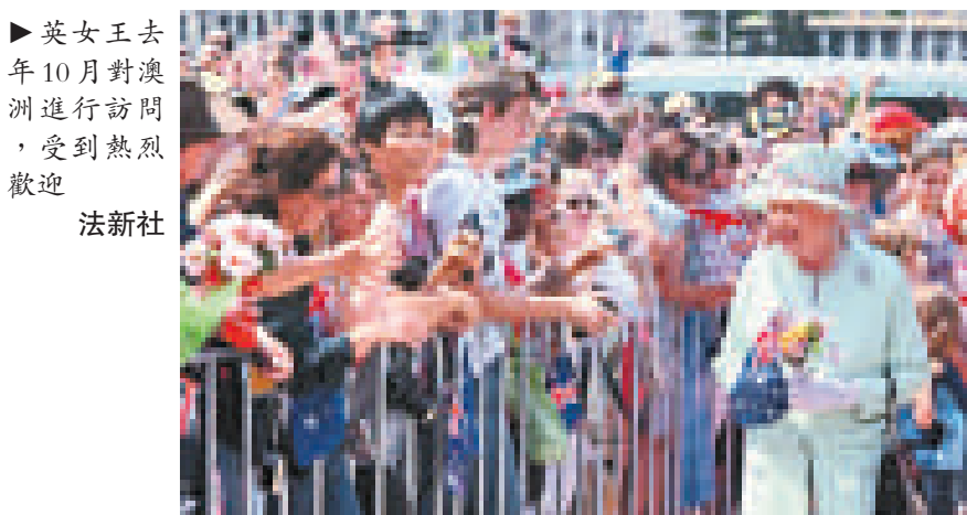
▶英女王去年10月對澳洲進行訪問，受到熱烈歡迎