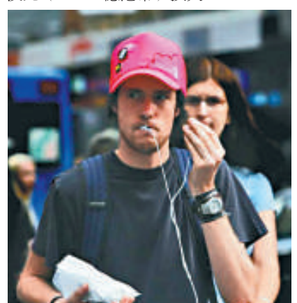
▶行人戴耳機走路易造成交通事故

據悉，與行人相關的個案佔去澳洲道路創傷案件的20%，每年造成270億澳元(2168.4億港幣)損失。