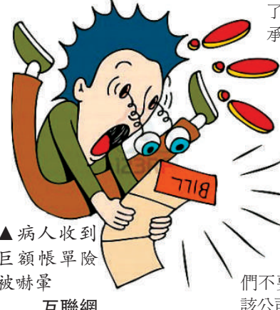
▲病人收到巨額帳單險被嚇暈

PHY Services請病人們不要理會有問題的錯誤帳單，該公司會把新的帳單重新寄出。