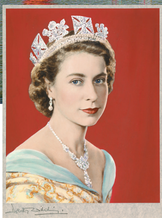
▲1952年登基時的英女王