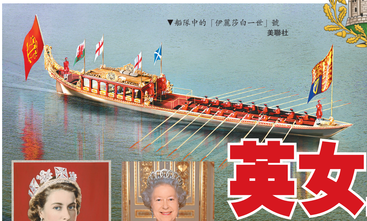
▼船隊中的「伊麗莎白一世」號