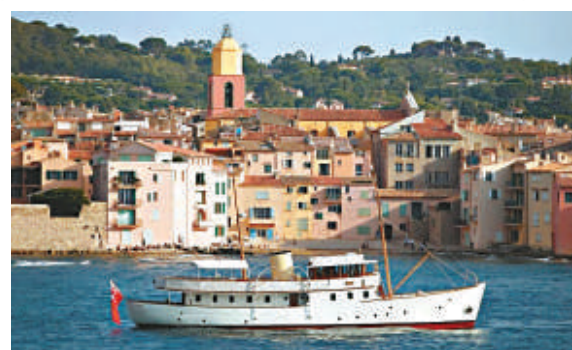
▲造於1938年的「藍鳥」號也將參與此次盛典 《每日郵報》