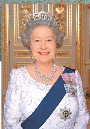
▲英女王喜迎2012登基鑽禧