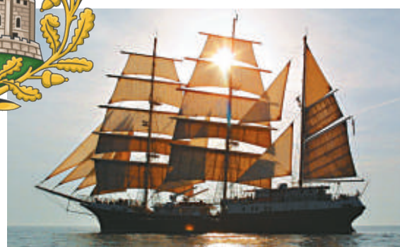
▲船隊中的「頑強」號 《每日郵報》