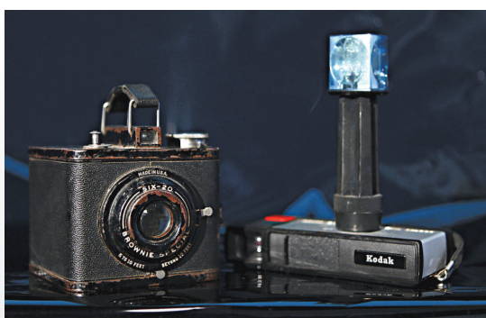
◀柯達最受歡迎的兩大機型和Pocket Instamatic(右)

反觀富士，儘管在柯達之後才推出首台民用數碼相機，但自從1999年研發出Super CCD技術後，富士就一直任在大力發展自己的數碼業務。2002年，柯達產品數字化比例只有25%，而富士已經達到了60%。數碼相機衝擊膠片業務之後，富士果斷進行大規模業務轉型，膠片不再是它的核心業務。此外，富士還選進利潤豐厚的醫療市場，目前他們的醫療業務包括了藥品研發、放射器械、醫療光學儀器，甚至還進入了化妝品市場。2008年開始，富士決定將醫療作為未來業務重心，影像業務所佔比重降至三成以下。