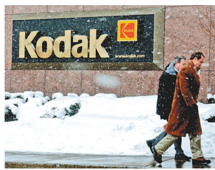
▲柯達位於美國紐約州羅切斯特市的總部

這是柯達第二次起訴三星電子侵犯其專利，此次涉及的是數碼相機圖像預覽技術方面的專利。三星電子曾支付5.5億美元和解此前的一樁訴訟，當時柯達指控三星侵犯其一項手機方面的專利。2010年柯達就已起訴過蘋果和黑莓公司。據悉，柯達已向超過30家公司授權數碼影像技術，其中包括LG、摩托羅拉、諾基亞等。