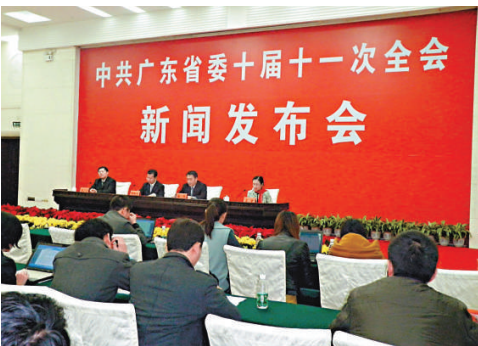
▲《中共廣東省委關於加強市、縣領導班子建設若干問題的決定》發布會現場

在堅持科學發展主題方面，提出探索建立科學發展年度、任期工作目標承諾責任制和實績「公開、公示、公議」制度；結合開展巡視工作，探索引入第三方測評。在貫徹民主集中制方面，要求黨政正職作團結的表率。在深入