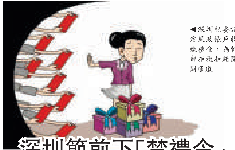
▲深圳紀委設定廉政帳戶收繳禮金，為幹部拒禮拒賄開關通道

力求注重廣東特色，突出了實效性，亦是一大特點。《決定》目標明確，要求具體，措施到位，注重落實。譬如在「弘揚改革銳氣」中強調要敢於打破既有利利益格局對「加快轉型升級、建設幸福廣東」的束縛等，力求體現時代特點和廣東特色。