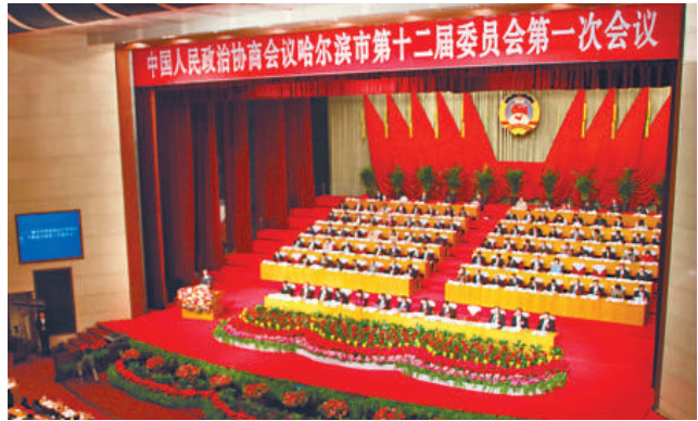
▲哈爾濱市政協十二屆一次會議