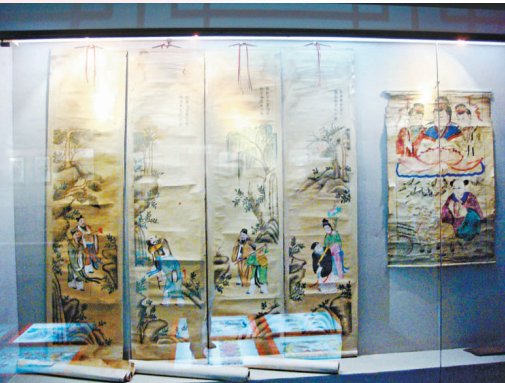
▲楊家埠年畫博物館裡收藏的古代年畫