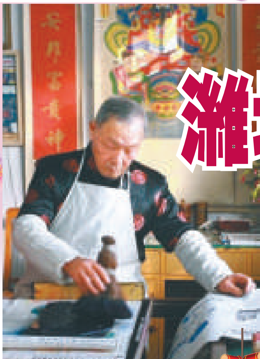
▲年畫老藝人在楊家埠民俗大觀園印製年畫