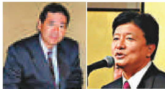
▲向山好一 ▲新藤義孝

1月3日，日本石垣市議員仲間均、仲嶺忠師夥同右翼分子無視中國政府立場，登上了中國固有領土釣魚島，在島上停留大約兩個半小時，並宣稱「新年應對領土問題重新認識，望政府重視」。對此，中國外交部發言人洪磊當天表示，中國政府已就此向日方提出嚴正交涉和抗議。他再次強調，釣魚島及其附屬島嶼自古以來就是中國的固有領土，中國對此擁有無可爭辯的主權。中國政府捍衛釣魚島領土主權的決心是堅定不移的。