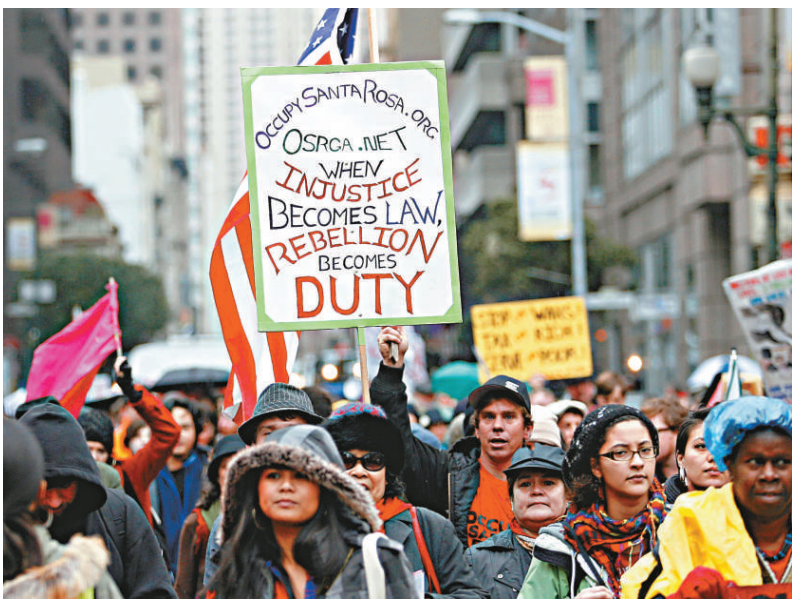
▲三藩市示威者在銀行和金融機構門外示威

【本報訊】據美聯社紐約20日消息：數以百計的群眾延續「佔領華爾街」行動，周五在全美各地百多座法院大樓門外示威，抗議最高法院兩年前作出裁決，撤銷大企業進行政治捐獻及資助美國大選候選人的上限。也有示威者在銀行和金融機構門外聚集，抗議金融霸權，其中數十人把自己鎖在三藩市富國銀行的總行大樓各個出入口。示威進行期間，部分地區的群眾與警察爆發衝突。