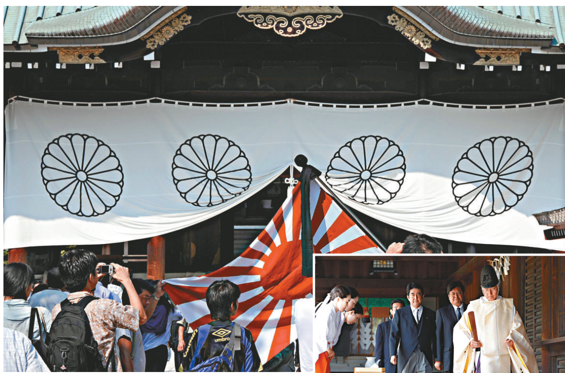
▲資料顯示靖國神社合祀戰犯由日政府主導

《朝日新聞》報道說，相關文件會保存在國立公文書館，聲稱不知道存在這些文件的前厚生省官員說，如果知道的話，會改變答辯的內容。而靖國神社則拒絕《朝日新聞》採訪。